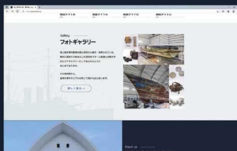
フォトギャラリーのサイト画面