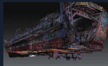
3DスキャンのCGの静止画

海上保安資料館横浜館は、国民の皆様到我が国周辺海域の現状と海上警備の重要性などをご理解していただくため、2004年12月10日に開館しました。館内には、2001年12月22日に発生した、九州南西海域工作船事件にかかる工作船及び回収物などを展示しています。